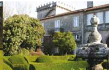
Pazo de A Saleta 5

San Vicente de Meis 36637 Meis (Pontevedra) jardinsaleta@hotmail.com 42°31'10"N 8°42'58"O