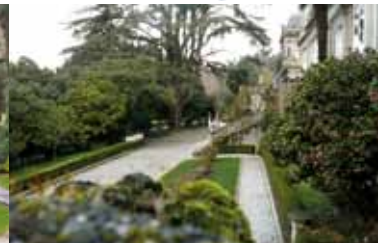
Pazo de Castrelos "Quiñones de León" 1

Parque de Castrelos, s/n 36213 Vigo (Pontevedra) www.museodevigo.org 42°12'64"N 8°43'39"O